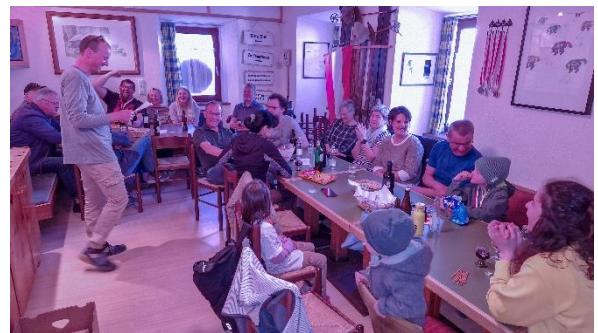
im Klublokal nach dem Gottesdienst