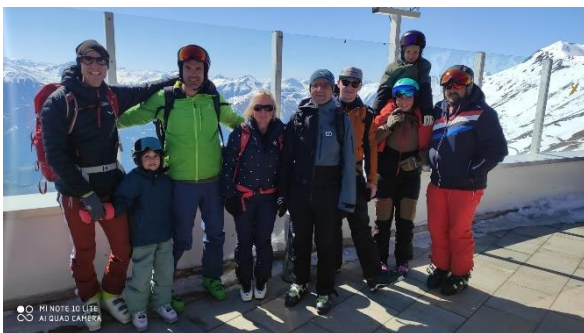
beim Bergdiamant am Schönjoch