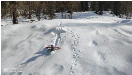
Gaudi im Schnee